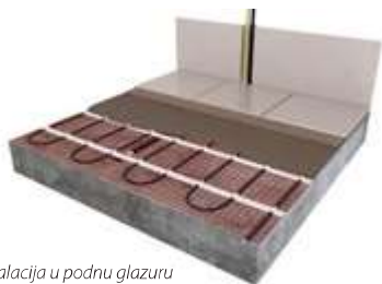
Instalacija u podnu glazuru