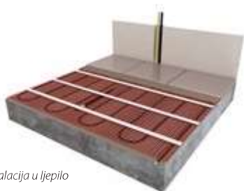
Instalacija u ljepilo

Električno podno grijanje neprimjetan je izvor topline za razliku od sustava grijanja s cijevima i radiatorima. Neotherm EAZY mrežice za električno podno grijanje ne zahtijevaju apsolutno nikakvo održavanje i koriste se u kompletu s EAZY naprednim digitalnim termostatima. Sustav je vrlo učinkovit i jednostavan za ugradnju, a toplina podova i jednostavna, napredna regulacija pružaju poseban osjećaj ugodne. Nema više hodanja po hladnim podovima!